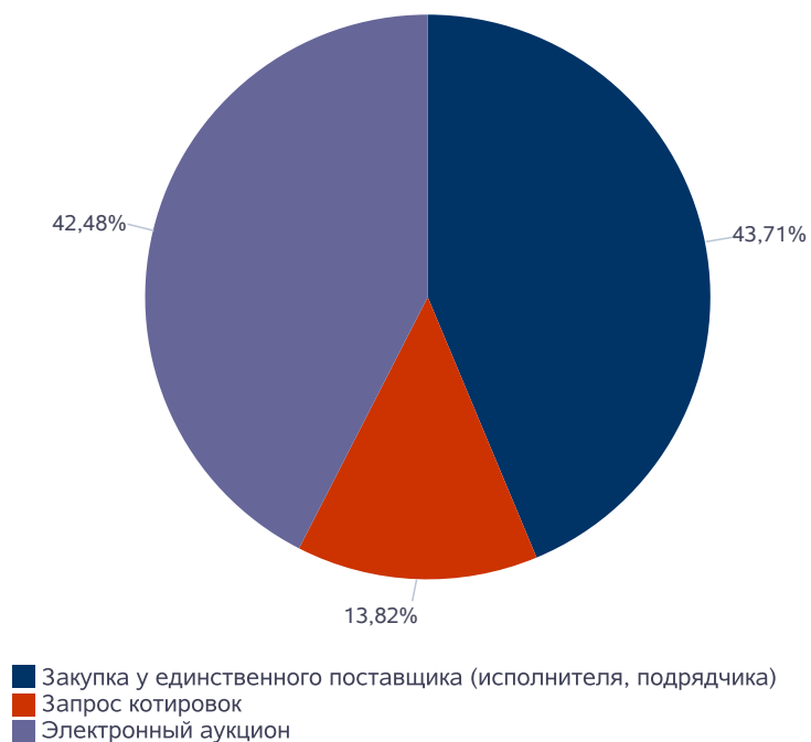
Начальная (максимальная) цена контрактов/лотов в опубликованных извещениях